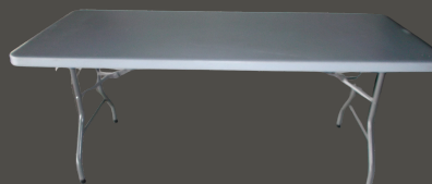
Mesa Retangular 180 x 75 CM