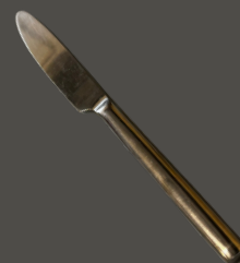
Faca de Sobremesa