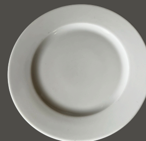
Prato de Sobremesa