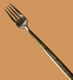
Garfo de Carne