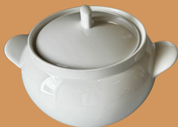
Terrina de Sopa