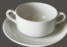
Taça de Consomé e Pires