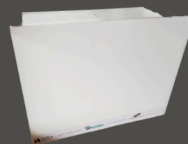
Balcão | Bar