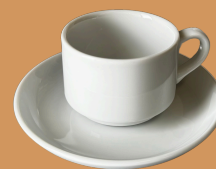
Chávena de Chá e Pires