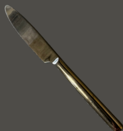
Faca de Carne