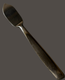
Faca de Peixe