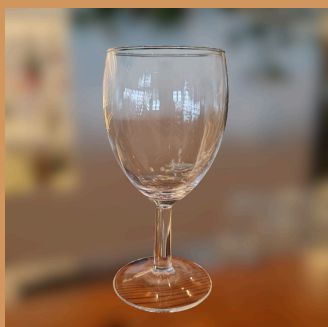
Copo de Água