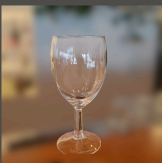
Copo de Vinho Tinto