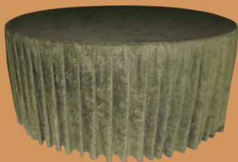
Toalha e Saia de Veludo

Mesa Redonda 180 CM | Mesa Retangular 180 x 75 CM