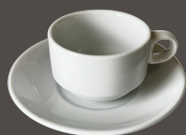
Chávena de Café e Pires