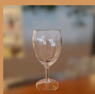
Copo de Vinho Branco