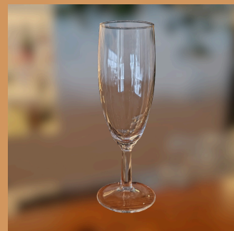
Flute de Champagne