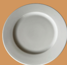
Prato a Pão