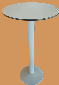
Mesa Bistrô de Pé Alto