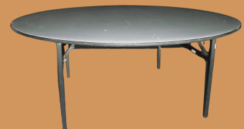
Mesa Redonda 180 CM