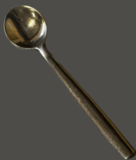
Colher de Sobremesa