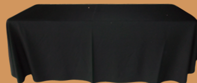
Toalha e Saia Preta