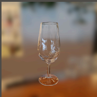
Cálice de Vinho Licoroso