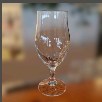
Copo de Cerveja