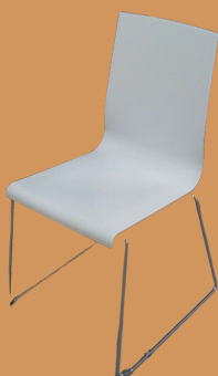
Cadeira Pé de Metal