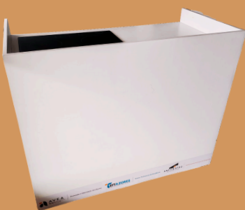
Balcão de Showcooking