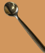
Colher de Café