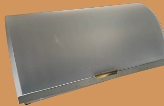
Caixa de Pão