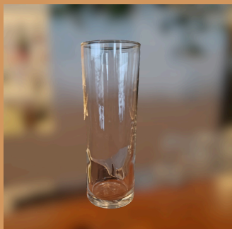
Copo Long Drink