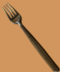
Garfo de Sobremesa