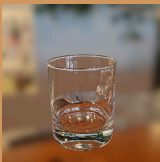
Copo On The Rocks