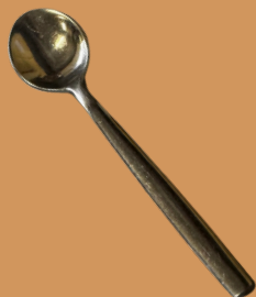
Colher de Sopa