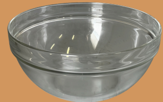
Saladeira de vidro 23 cm