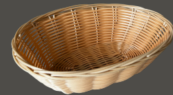
Cesto de Pão